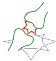
MEDICINA DEL DOLORE/ORTOPEDIA/ REUMATOLOGIA