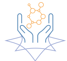
HEALTHY AGING E MEDICINA RIGENERATIVA