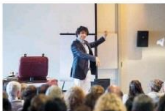
Il mentalista Federico Soldati, tra gli ospiti

Si conclude questo pomeriggio alle 17.30 la settimana di 'Let's Science!', il progetto promosso da Ibsa Foundation per la ricerca scientifica e dal Decs del Canton Ticino, pensato per l'apprendimento e per l'orientamento alle future scelte professionali di ragazze e ragazzi. Il Lac ospiterà l'evento gratuito 'Digitale: tra illusione e realtà', organizzato in collaborazione con Lugano Living Lab nell'ambito del progetto Digitale Consapevole. I partecipanti potranno comprendere in modo alternativo e originale i rischi e le opportunità del web grazie all'aiuto delle tecniche del mentalista di fama internazionale Federico Soldati e all'expertise di Laura Marciano. Gli altri interventi: Gianluca Dotti, giornalista scientifico, spiegherà gli aspetti da non sottovalutare legati al marketing online; Rosalba Morese, ricercatrice post-doc e docente presso l'Università della Svizzera italiana, esperta in neuroscienze sociali, accenderà l'attenzione sul tema delle frodi online e dei dati sensibili; lo psicologo specializzato sull'uso/abuso dei digital device Dario Gennari affronterà il tema della reputazione legata all'immagine di sé derivante dall'uso di diverse piattaforme web. Saranno inoltre presenti Lhayla Blendinger, redattrice digitale Rsi Wetube, Edu e Kids e Giorgia Blotti, redattrice capoedizione Spam, con un intervento dedicato alla produzione e alla realizzazione dei contenuti digitali. Tutti i dettagli su www.ibsafoundation.org .