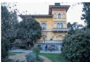
A Villa Saroli dal 12 al 17 settembre