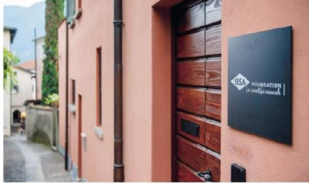
Attiva dal 2012, ora ha trovato casa a Castagnola

Lo storico edificio è la nuova sede della Fondazione Ibsa