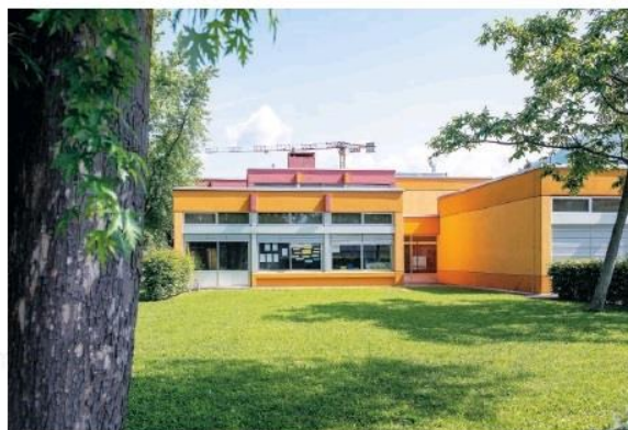
La scuola elementare della Gerra

Il successo dell'Paula nel bosco L'evento inaugurale è stato anche l'occasione per (ri)presentare un'altra importante novità: Paula nel bosco di Brè. Inaugurata nel 2020, ha subito un