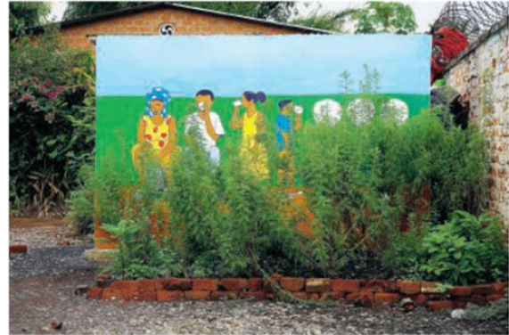
Learning from Artemisia

Recentemente i suoi lavori sono stati presentati all'Aargauer Kunsthaus, al Kunsthaus di Zurigo, alla Tate, alla Whitechapel Gallery e all'Institute of Contemporary Arts a Londra e al Palais de Tokyo a Parigi.