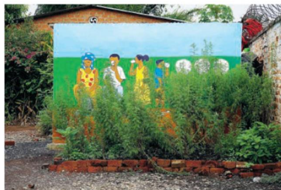
Learning from Artemisia

Recentemente i suoi lavori sono stati presentati all'Aargauer Kunsthaus, al Kunsthaus di Zurigo, alla Tate, alla Whitechapel Gallery e all'Institute of Contemporary Arts a Londra e al Palais de Tokyo a Parigi.